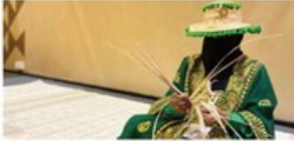
جذب الحرفيين المتميزين بالشرقية (اليوم)

وبيّنت أن المملكة تتميز بتنوع الحرف اليدوية بناءً على التنوع الثقافي والتراثي بين مناطقها، لافتة إلى أن الكثير من المؤسسات غير الربحية كالجمعيات الخيرية لها مبادرات رائعة في الاهتمام بالحرفيين والحرفيات ورعايتهم ودعمهم في خطوط الإنتاج للحرف التقليدية، التي يحرص كثير من السائحين والمواطنين على اقتنائها مثل صناعة النسيج والخزف والسعف.